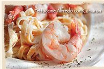
Fettuccine Alfredo con Camaron

PASTA CLASICA ITALIANA CON Salsa A BASE DE QUESO PARMESANO 99 CON POLLO 129 CON CAMARON 159