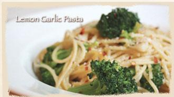
Lemon Garlic Pasta