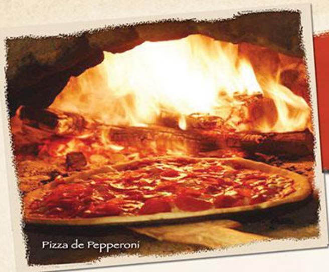
Pizza de Pepperoni